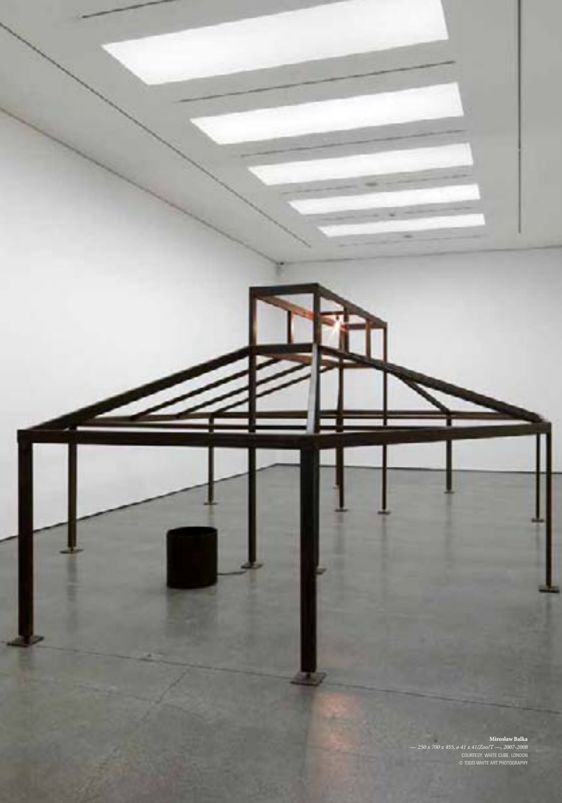
Mirosław Balka — 250 x 700 x 455, ø 41 x 41/ZoomT — 2007-2008 COURTESY WHITE OUBE, LONDON

Ontdek met 'Luc Tuymans: Een visie op Centraal-Europa' een eigenzinnig en actueel beeld van een regio in volle beweging.