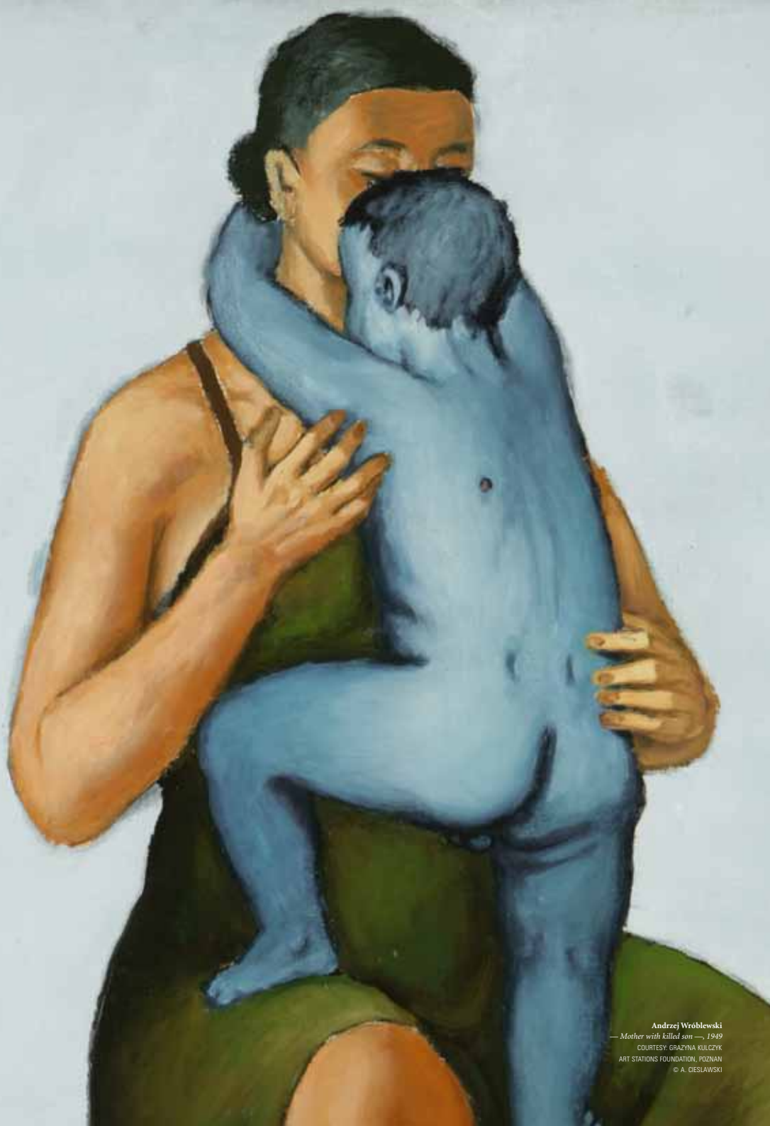
Andrzej Wróblewski — Mother with killed son —, 1949

Découvrez avec 'Luc Tuymans: Point de vue sur l'Europe centrale' un panorama d'une scène artistique contemporaine en pleine mutation.